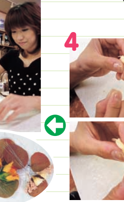
ドライバラの根元の部分にワイヤーを差し、花の部分を壊さないように気をつけながらワイヤーをねじって固定します。お好きなドライフラワーも同様にしてワイヤーを通しておきます。