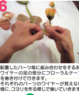
配置したパーツ毎に組み合わせをする為、ワイヤーの足の部分にフロラルテープを巻き付けて行きます。それぞれのパーツのワイヤーが見えない様に、コヨリを作る感じで巻いていきます。