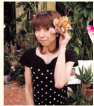
ゆかりん(今回初体験) 取材協力: はな里