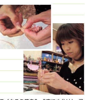
ドライバラの根元の部分にワイヤーを差し、花の部分を壊さないように気をつけながらワイヤーをねじって固定します。お好きなドライフラワーも同様にしてワイヤーを通しておきます。