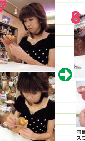
中央となる造花とAリーフ3枚程度を束ね、フロラルテープで巻きます。