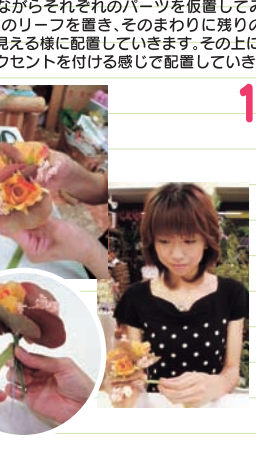
それぞれのパーツを前行程でイメージした完成予想を思い出しながらワイヤーの部分で1本にまとめていきます。