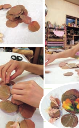
それぞれのパーツの下準備が出来た所で、実際の完成予想をイメージしながらそれぞれのパーツを仮置きしてみましょう。中心に5~6枚のリーフを置き、そのまわりに残りのリーフを重ね、立体的に見える様に配置していきます。その上にカスミ草・バラ・造花をアクセントを付ける感じで配置していきます。