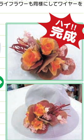
1本にしたワイヤーの部分にラフィア(リボン)を結び、はみ出たワイヤーやラフィアをカットして全体の形を整えたら完成です。 ※Aリーフやドライフラワーにワイヤーを通す際には、ワイヤーで手を傷つけない様に注意しましょう。力をいれ過ぎてドライフラワーがガロガロにならない様に注意しましょう。