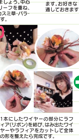
1本にしたワイヤーの部分にラフィア(リボン)を結び、はみ出たワイヤーやラフィアをカットして全体の形を整えたら完成です。 ※Aリーフやドライフラワーにワイヤーを通す際には、ワイヤーで手を傷つけない様に注意しましょう。力をいれ過ぎてドライフラワーがガロガロにならない様に注意しましょう。