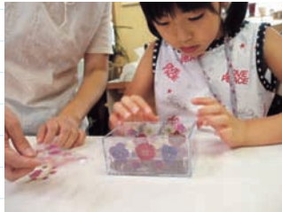
底の部分にボプリを入れ、ケース内側の四辺に差し込みます。