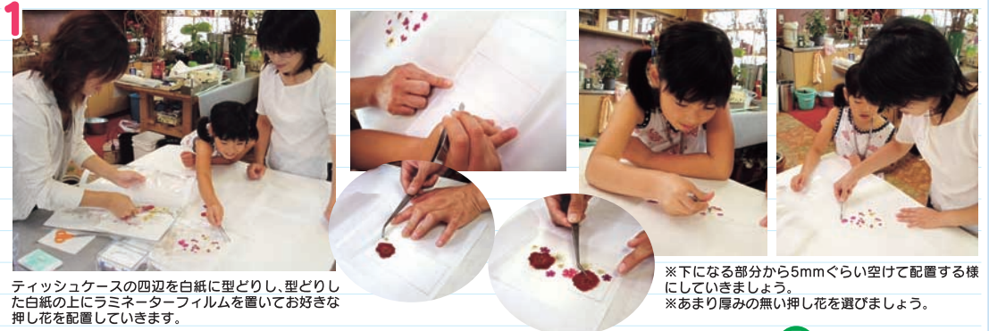
ティッシュケースの四辺を白紙に型どりし、型どりのした白紙の上にラミネーターフィルムを置いて好きな押し花を配置していきます。

※下になる部分から5mmぐらい空けて配置する様にしていきます。 ※あまり厚みの無い押し花を選びましょう。