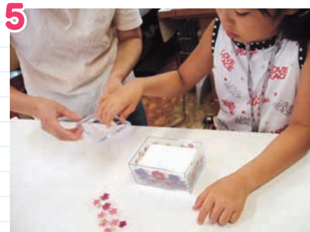
ポケットティッシュを包みから出してボプリの上に乗せ、上ぶたに乗せて完成です。