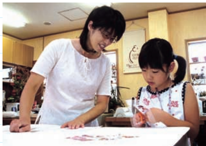
出来上がったフィルムを型紙にセロテープで固定し、型紙の大きさにカットします。