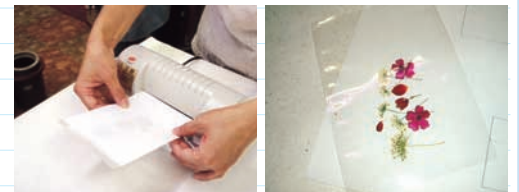
フィルムをくりりと覆えるぐらいの大きさにカットした白紙で、押し花を挟んだフィルムをはさみゆっくりとラミネーターに通して圧着していきます。 ※ラミネーターの熱でお子さまが火傷しない様に注意しましょう。 ※ラミネーターに通す時にはフィルムの開く口と反対の方から通す様にします。